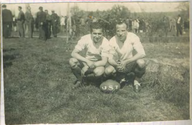
1945-46 Torrrens - Cadix