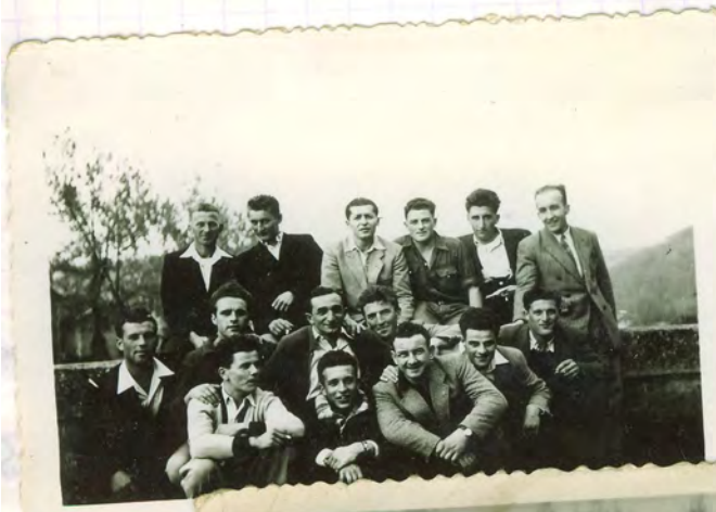
1951 C. Pairec XIII Entraîneur Cadis Tonneil XIII Entraîneur Cadis