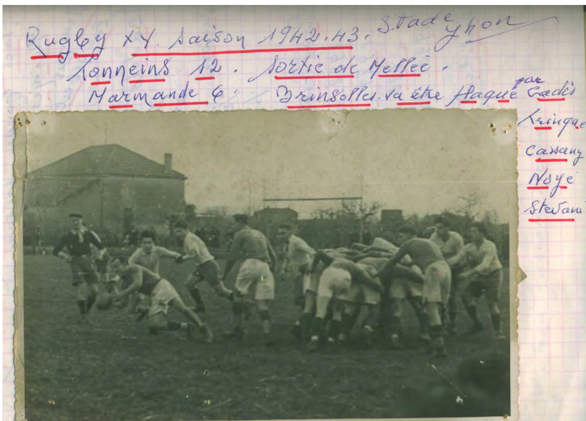
Sabaté-Cibeau-Trinque-Doumax-Castagnet-Demont-Stivani-Quaranta-Noyé-Dupuy-Arcs-Fouyssat-Cassany-Vautrain-Demont Jean-Blessé Cadis