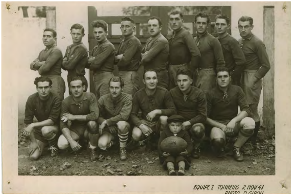
EQUIPE 1 TONNEINS 2 NOV 41