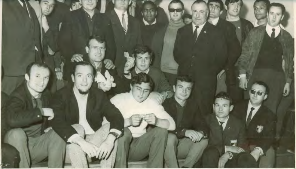
Photos après la victoire sur Paris XIII Honneurs Supporters Fatigue et joie 1 er titre