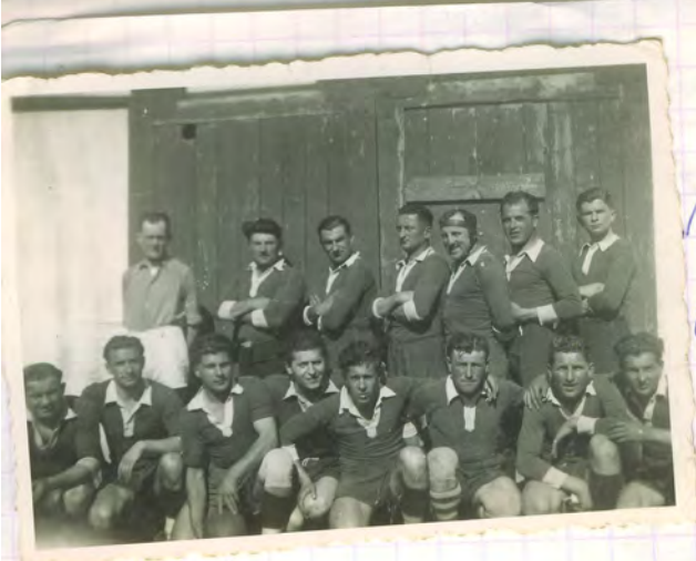
Tonneil XIII Entraîneur vic 1944