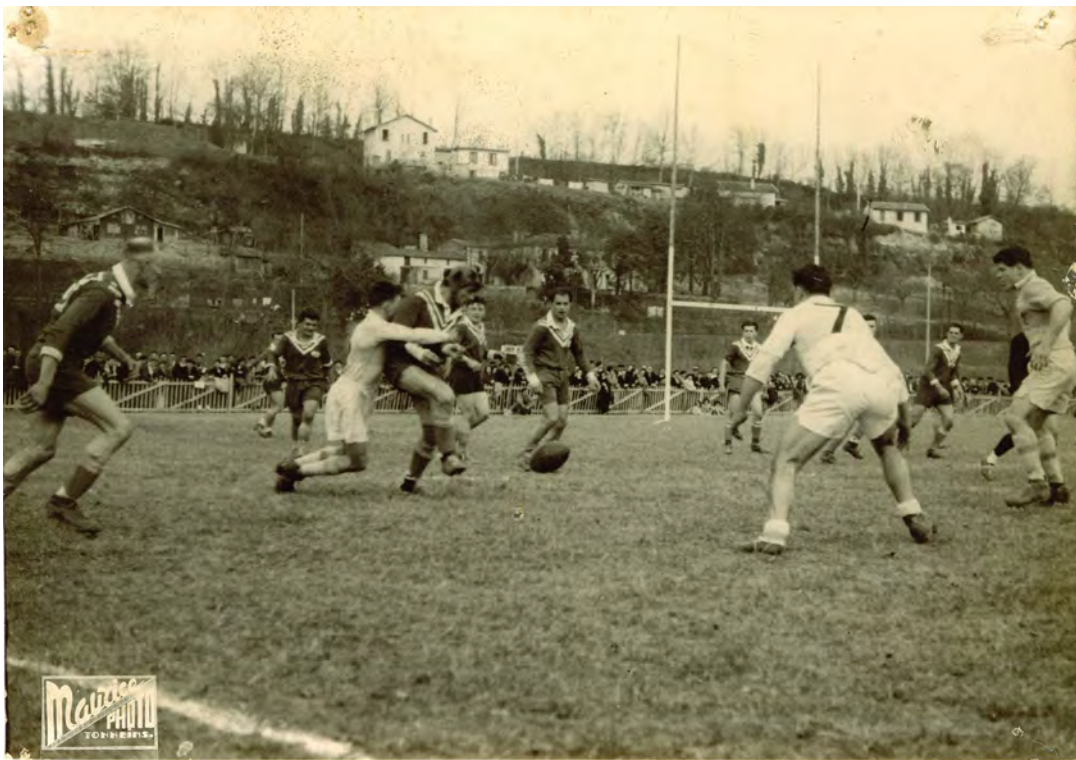
Finale coupe de France 1948-1949 Tonneins 6 – Arcachon 9