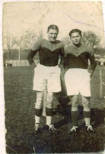
Bach. Cadix Racourgn 1947-48 Racourgn 1937 ↓ - Cadix