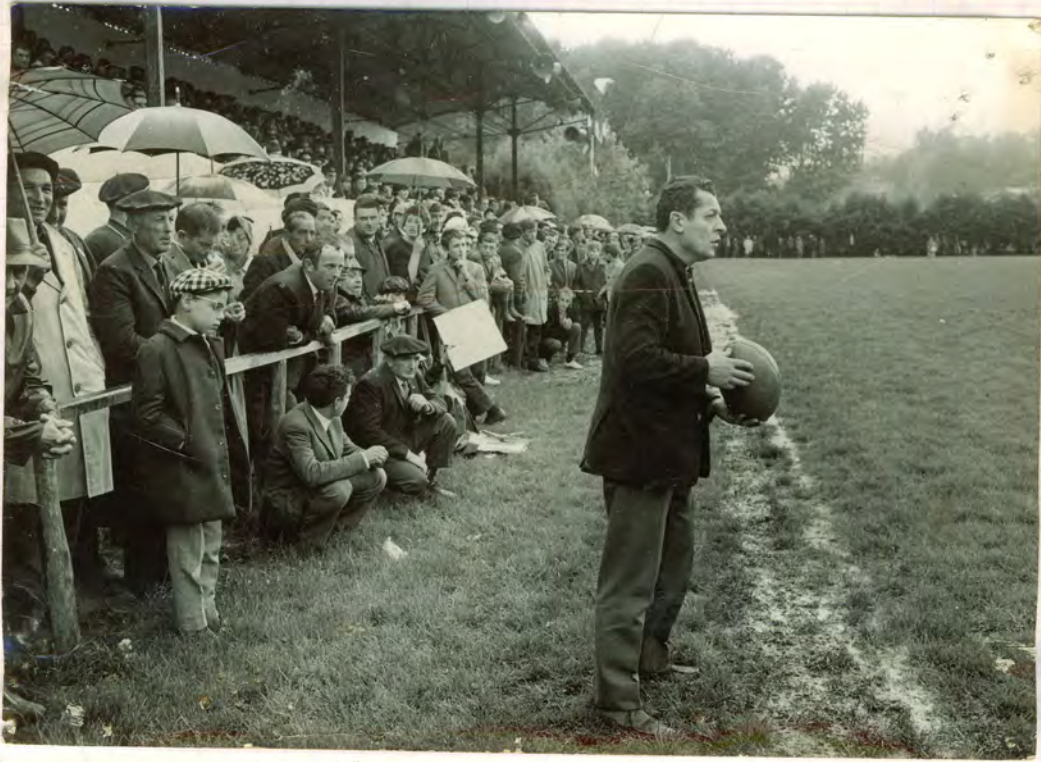
Tour d'Honneur : Les joueurs sortent en triomphe : Pano. Cadix