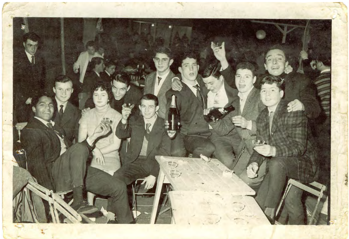
1957 bal place du château