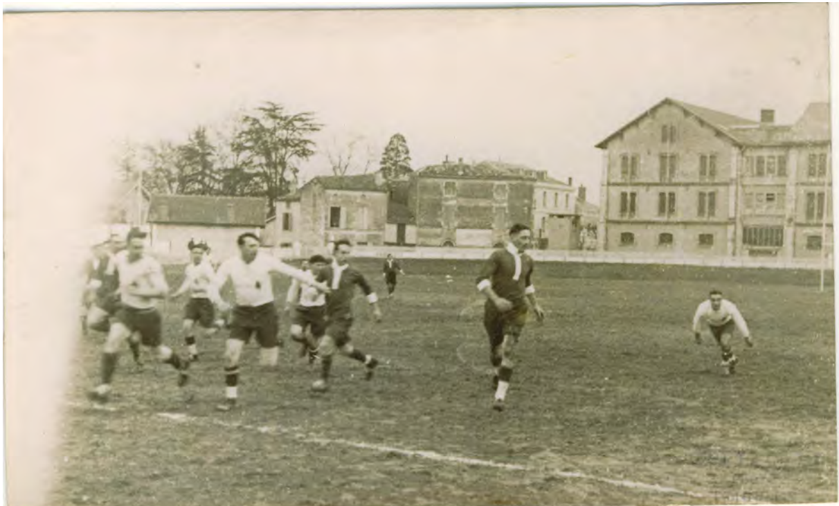
Sabaté - Sibau - Trimpue - Doumax - Castagnet - Demont - Skivany - Caranta - Noye Dupuy - Arés - Fouissac - Cassany - Vautrin - Demon