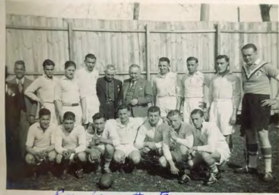
Equipe - A.S. -