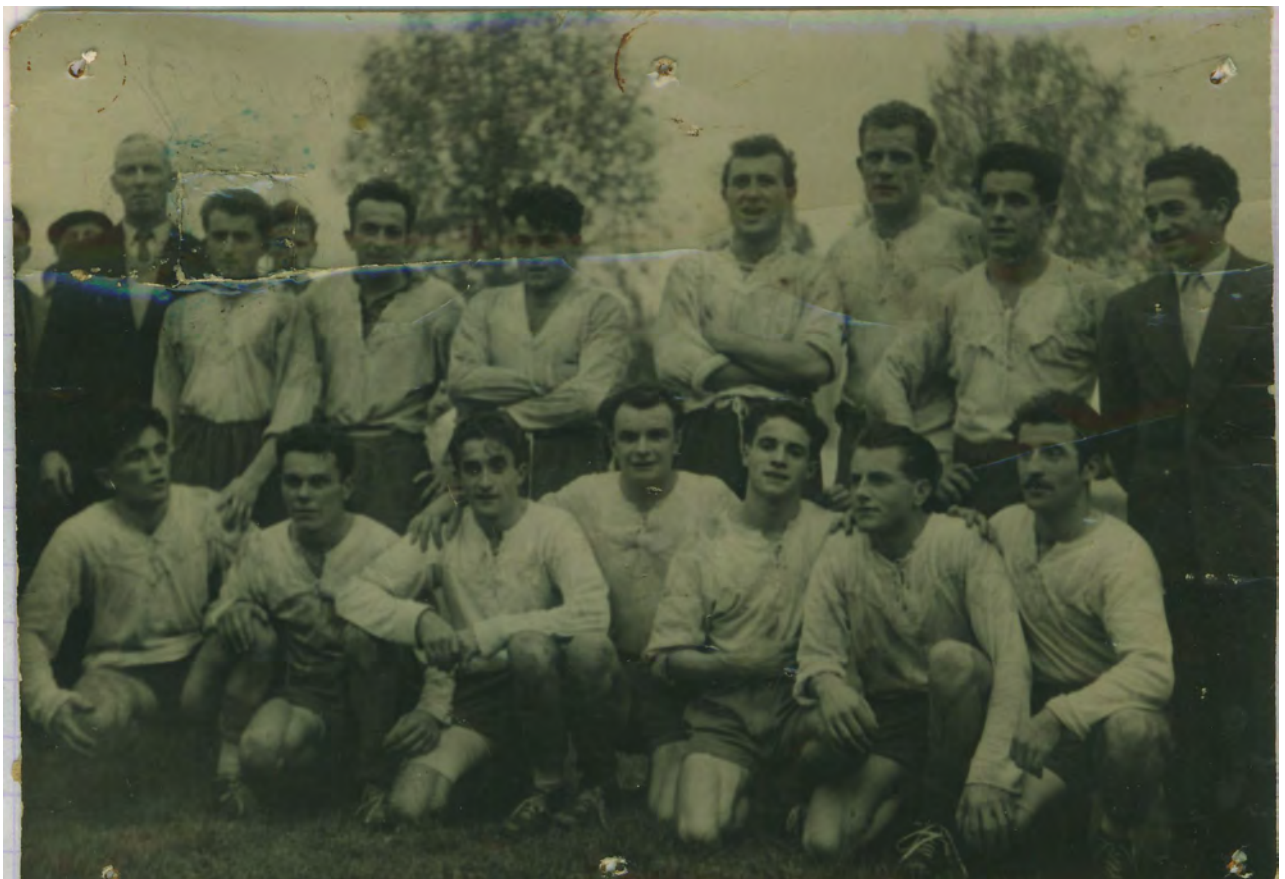
1954-1955, l'équipe qui a battu Lavardac.