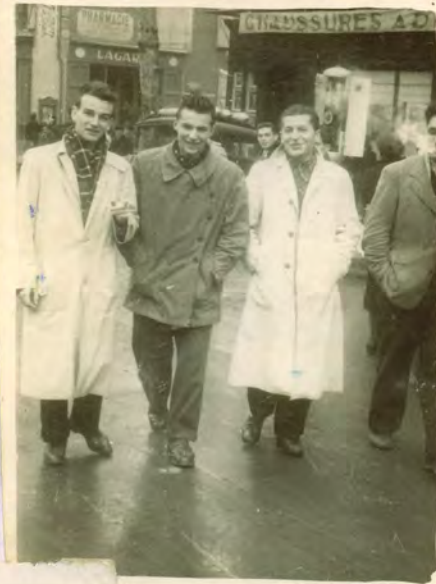
Agen Sportif 1939