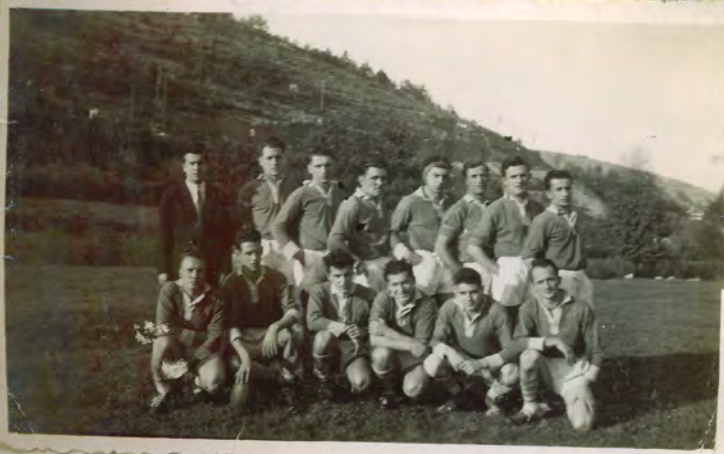
Calhotes XIII - Entraîneur ch. Cadix 1947-48