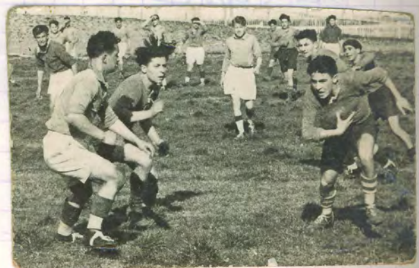
1935 Vautrain - A Hague Cadix - Rasfenne