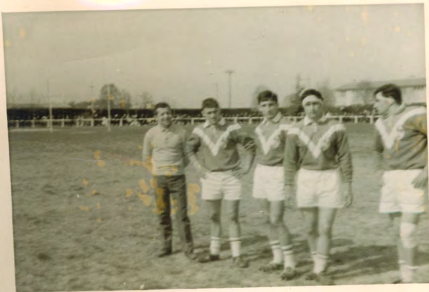
L. H. 67. à Toncins. France 14. Angleterre 8.